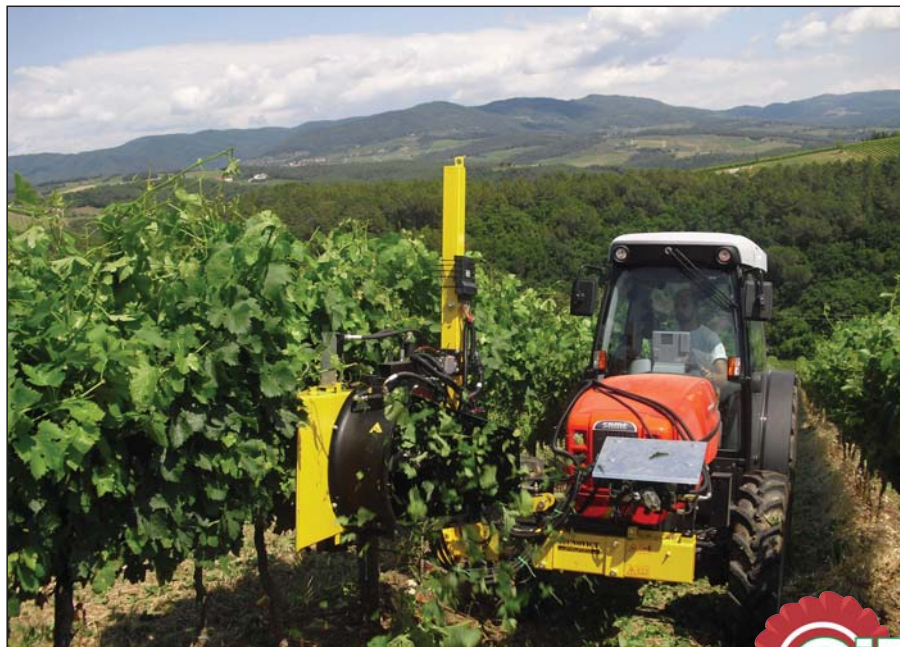
Lavorazione con attrezzatura orientata a destra