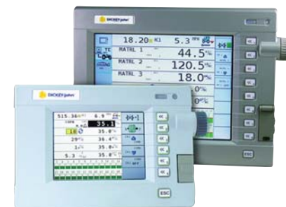
DICKEY-john Virtual Terminal

SPEZIA s.r.l. Viale Castagnetti, 7 29010 Pianello V.T. (Pc) Tel. 0523.998815 Fax 0523.998777 E.mail posta@tecnovict.com www.tecnovict.com www.agriprecisione.it TECNOVICT